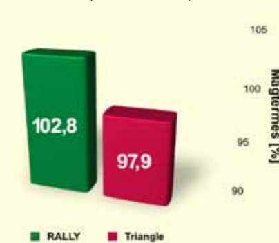
Rally teljesítménye (2009 MGSZH)

A LENNY nagyon magas magtermésű, olajtartalmú, kiemelkedő állóképességű és kitűnő ellenálló képességű fajtarepece. Minden repcetermelő körzetbe ajánlható.